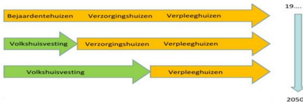
Diagram richting transformatie verpleeg- en verzorgingshuizen

Een steeds kleiner aantal Amsterdammers woont nog in de 'oude' verzorgingshuizen op grond van hun eerder verkregen indicatie. Omdat de regelgeving het niet langer toelaat dat ouderen met een lichte zorgvraag een indicatie krijgen voor zorg met wonen binnen een zorginstelling, is er geen nieuwe instroom in de nog aanwezige verzorgingshuizen. Het klassieke verzorgingshuis is door de scheiding van wonen en zorg (extramuralisering) daarom ook in Amsterdam praktisch verdwenen. Ouderen gaan meestal pas op zeer hoge leeftijd en alleen wanneer zij een zware zorgvraag hebben naar een verpleeghuis. De vraag naar geschikt wonen met lichte en zware zorg zal in Amsterdam door de verdergaande vergrijzing wél toenemen.